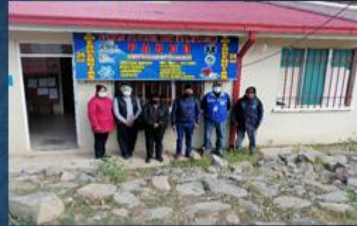
ACTIVIDAD: Visita al Centro de Salud de Parco