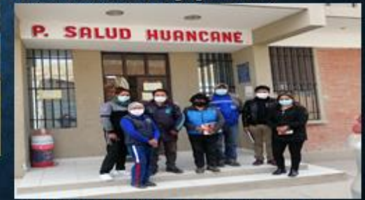
ACTIVIDAD: Visita al Centro de Salud Huancane