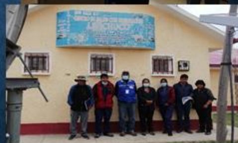
ACTIVIDAD: Visita al Centro de Salud Livuchuco