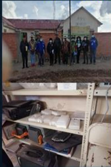
ACTIVIDAD: Visita al Centro de Salud Tolapalca