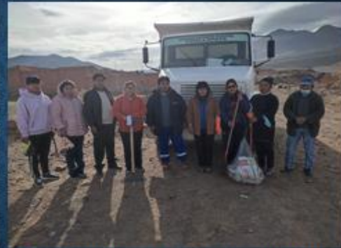
ACTIVIDAD: Participación en la campaña de limpieza de residuos solidos