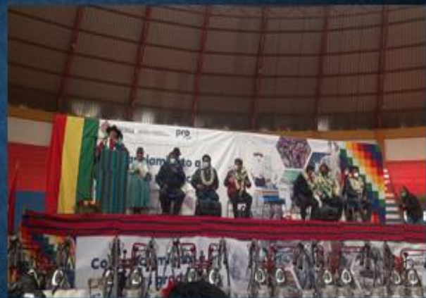
ACTIVIDAD: Participación de la inspección y entrega de PROLECHE