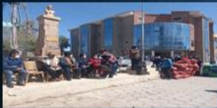
ACTIVIDAD: Entrega de semillas U.G.R.