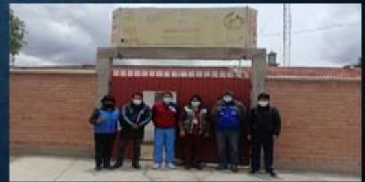
ACTIVIDAD: Visita al Centro de Salud Humamarca