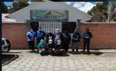
ACTIVIDAD: Visita al Centro de Salud Qaqachaca