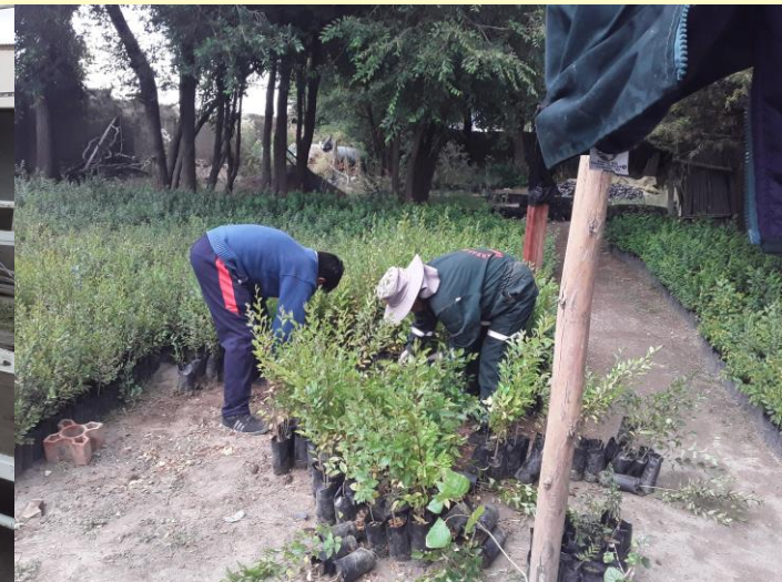
PRODUCCIÓN DE PLANTINES